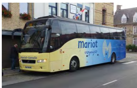
Ouf ! une place de stationnement

Un tramway des années 1900 reconstitué nous a emmenés à travers Bergues. Quelques commentaires nous ont décrit l'histoire de la ville et indiqué le patrimoine à ne pas manquer