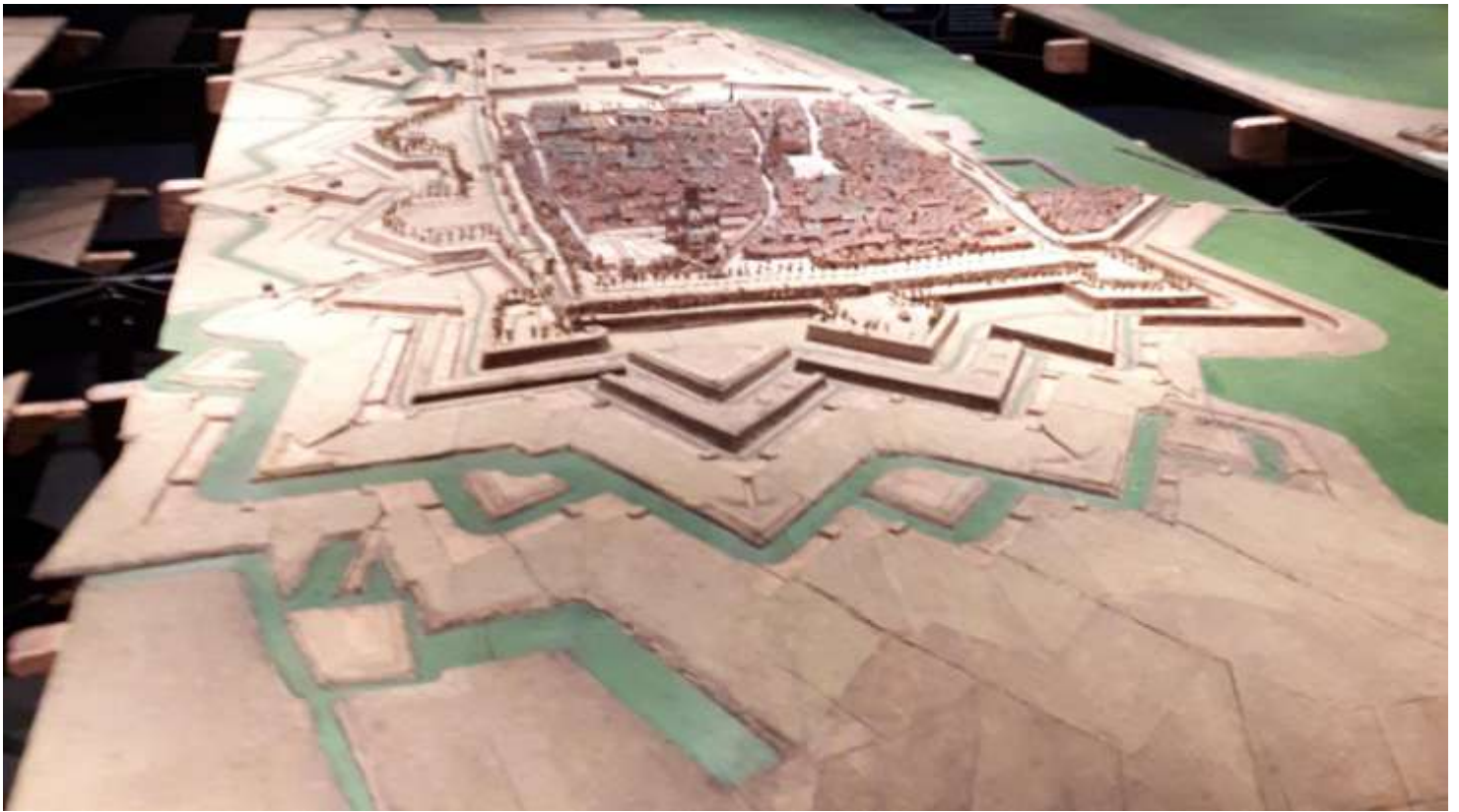
Calais (avec la table ouverte)