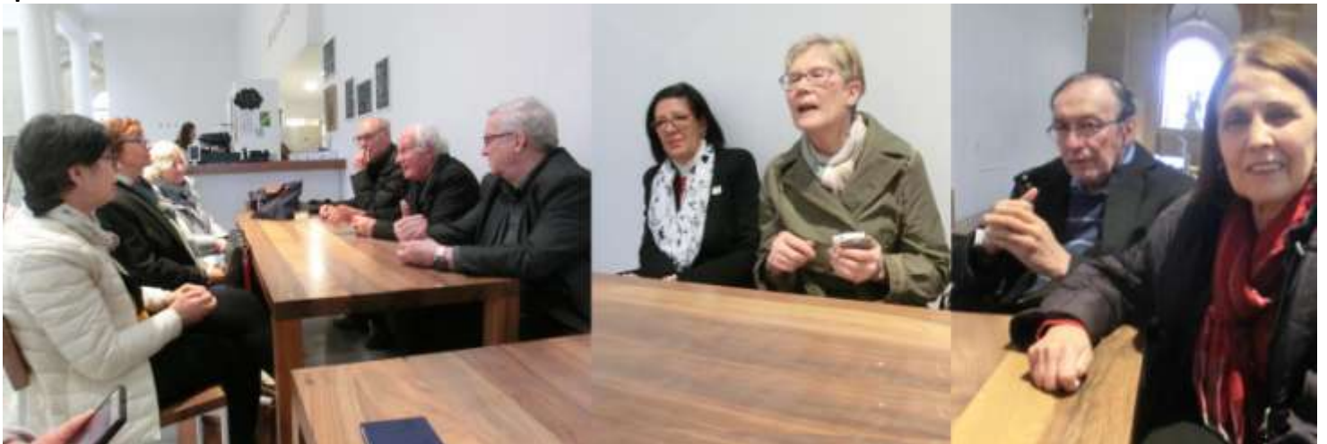
La pause café après la visite, partagée avec quelques collègues