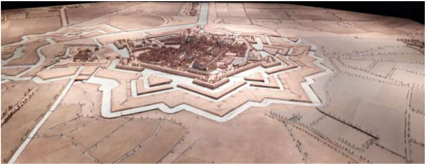
Avesnes sur Helpe