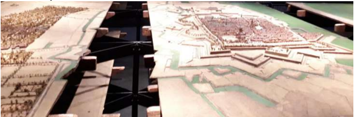
Calais (avec la table ouverte)