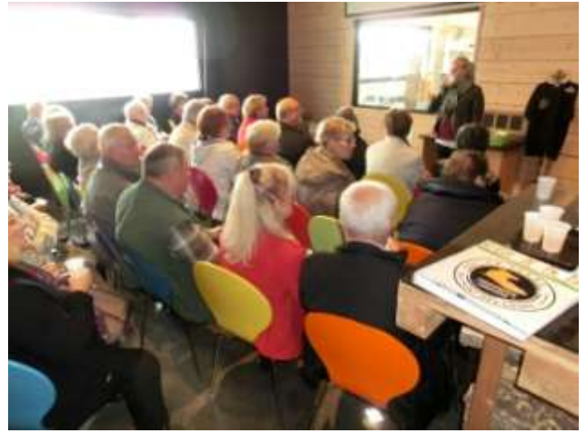
On y apprendra tout sur la fabrication du Maroilles,