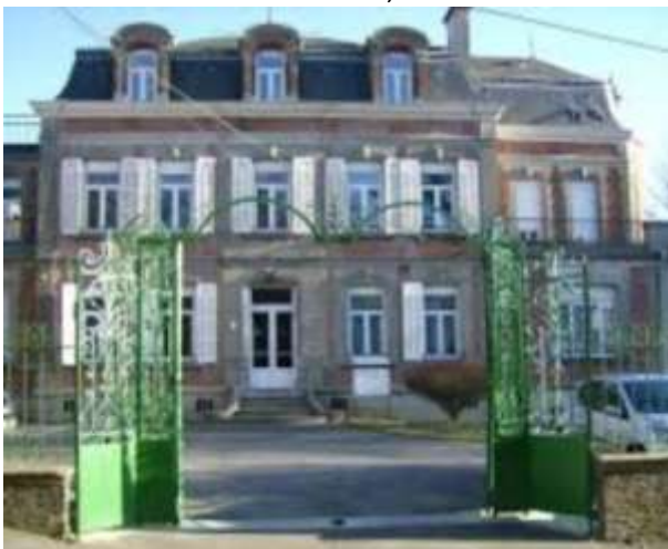
Le Lycée agricole Charles Naveau de Sains du Nord