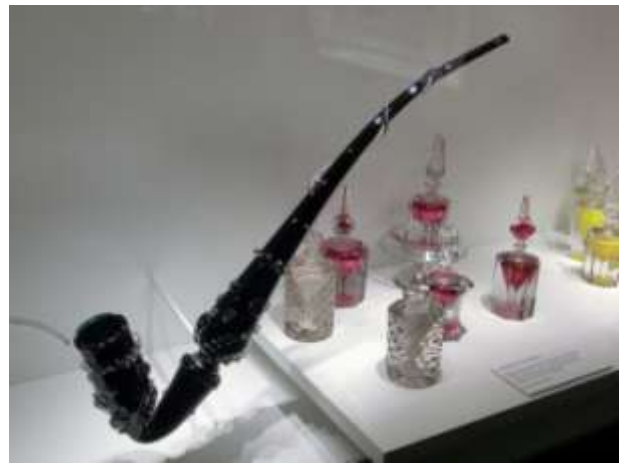
Pipe réalisée par Jules Vital Anuzet, Verre soufflé.