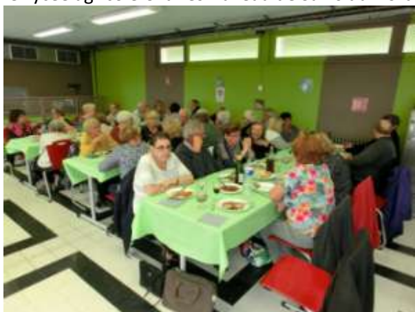
Une partie de notre groupe