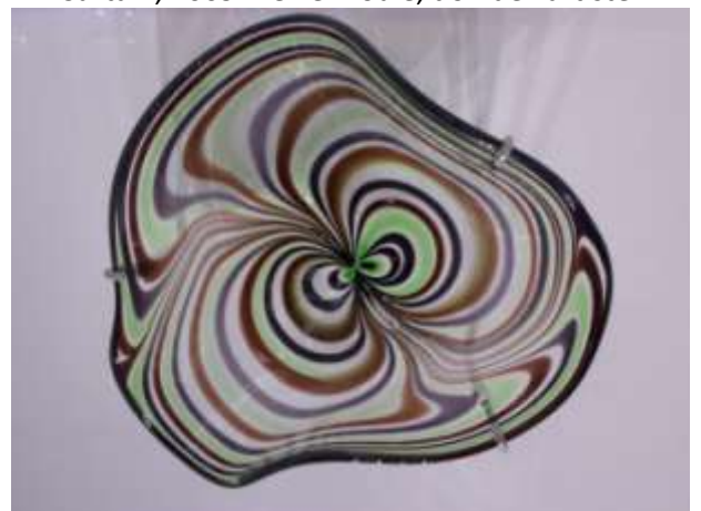
Willem Heesen, Pays Bas, 1925 – 2007 Don de l'artiste.