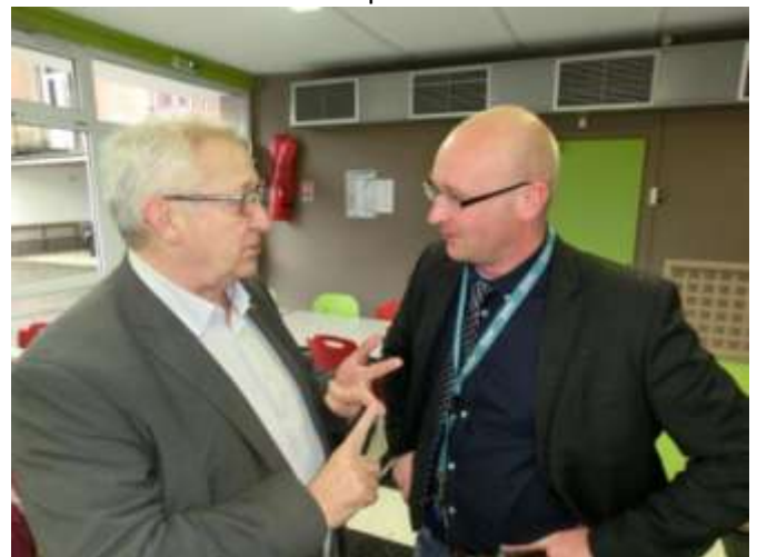
Remerciements du Président au Proviseur