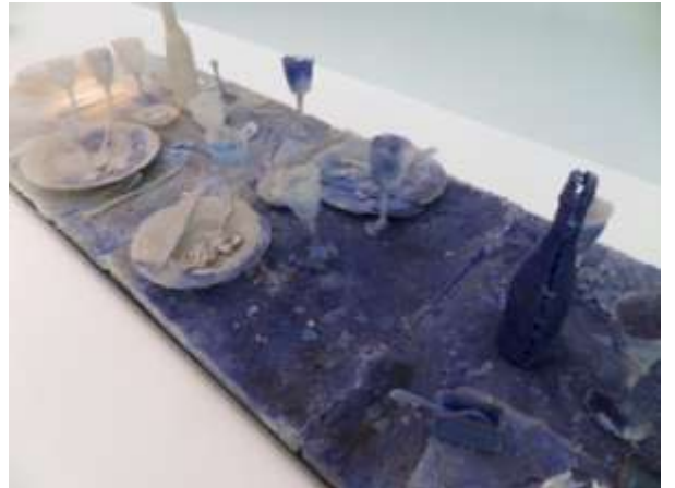
Joan Crous, Espagne, 1962. Cénæe 9, 2008. Pâte de verre. Œuvre réalisée lors d'une résidence à l'atelier du verre