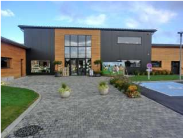
La fromagerie de la ferme du pont des loups à Saint Aubin