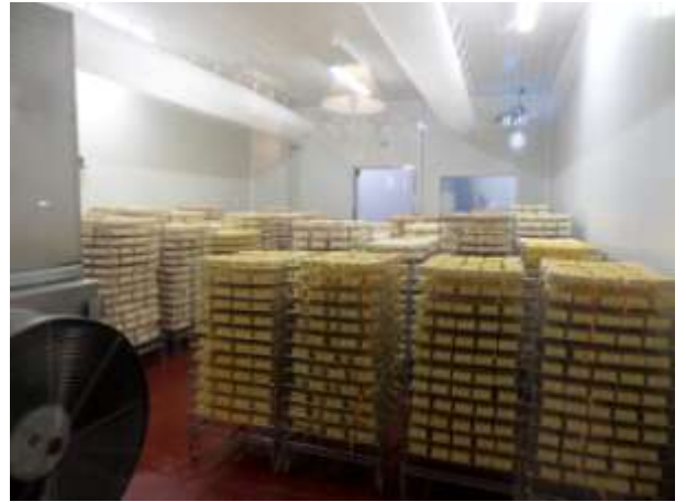
avec une vue sur une partie des installations.