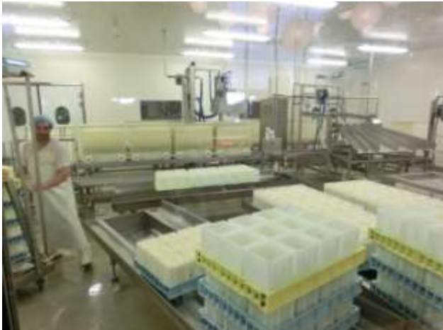
de la boulette d'Avesnes, du Vieux Lille ...