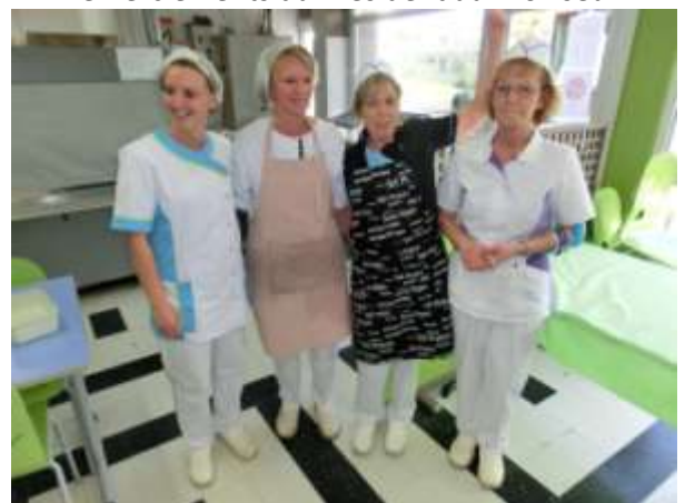
Le service par des collègues très souriantes