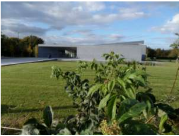
Le Mus'verre à Sars Poteries